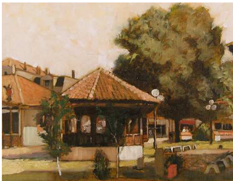
Драгољуб Станковић „Чиви“: Стари Лесковац